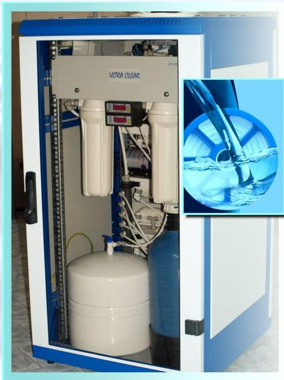
ULTRA CLEAR Water Purification System